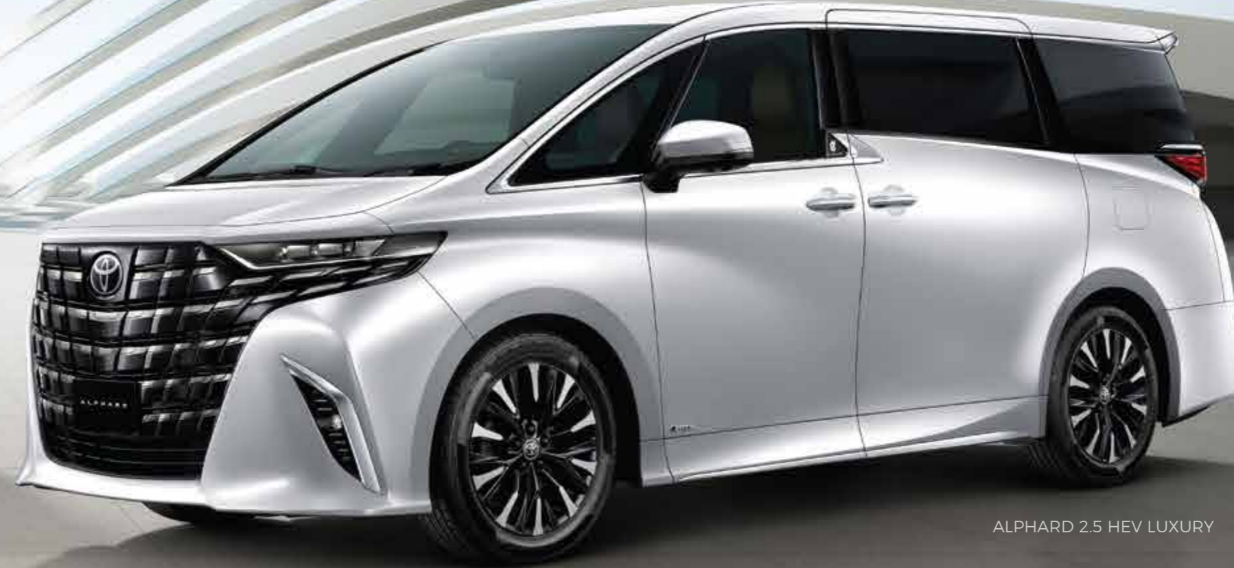
ALPHARD 2.5 HEV LUXURY

ยนตรกรรมหรู ที่มาพร้อมกับดีไซน์ภายนอกถ่ายถอดแนวคิด “ความสง่างามและทรงพลัง” การออกแบบภายในที่ปราณีตทุกรายละเอียด ห้องโดยสารกว้างและเซียบ ให้การขับเคลื่อนที่นุ่มนวล ที่สุดแห่งสุนทรีย์ในทุกการเดินทาง