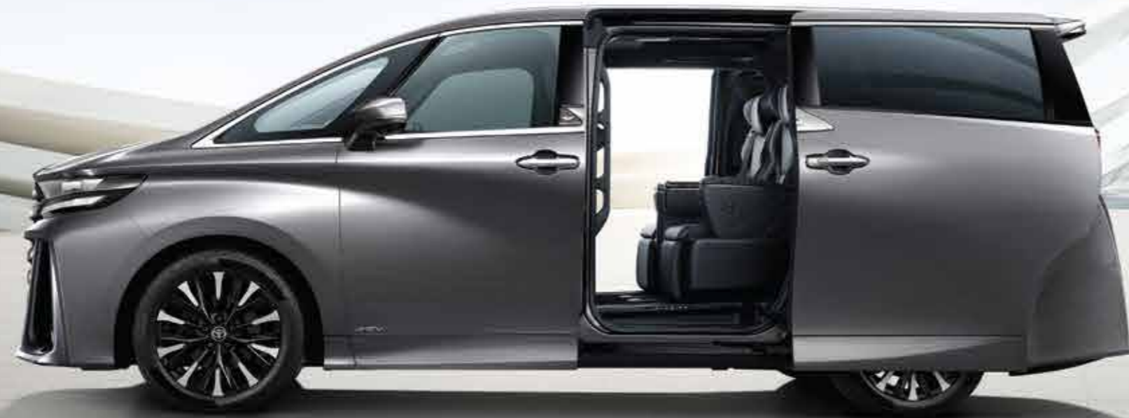
VELLFIRE 2.5 HEV